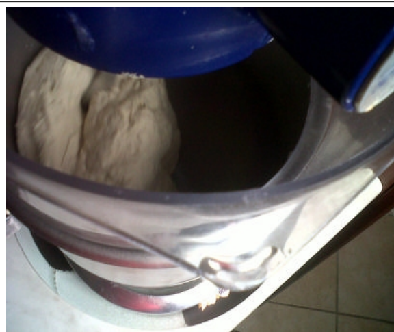
Iniziare a lavorare l'impasto in prima velocità.