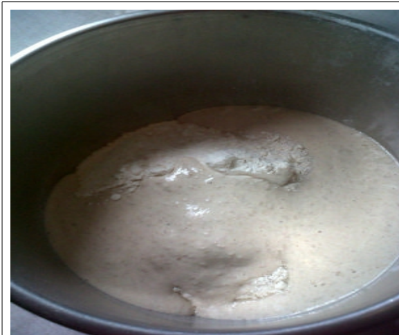
Unire la farina e il lievito madre.